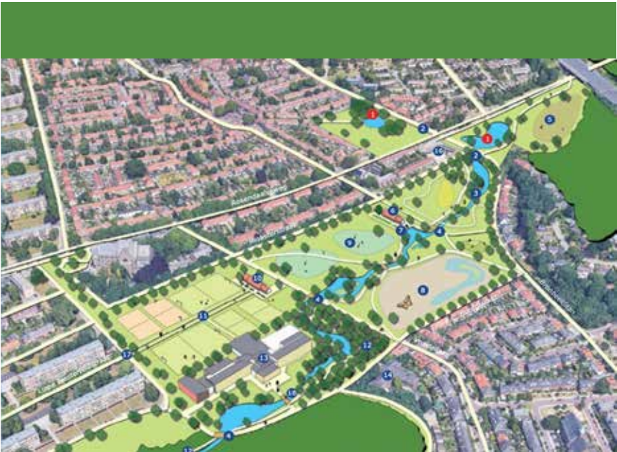
Streefbeeld Park Beek op de Paasberg (zie het rapport 'Verkenning en visie' op de wijkwebsite)

De gemeente is hiervoor nog op zoek naar een geschikte projectleider. Verder is het streven al deze zomer te beginnen met een aantal beekherstelmaatregelen, zoals het verwijderen van zicht-belemmerende hekken. Een verrassende, inspirerende ontwikkeling. Als Initiatiefgroep blijven we alert!