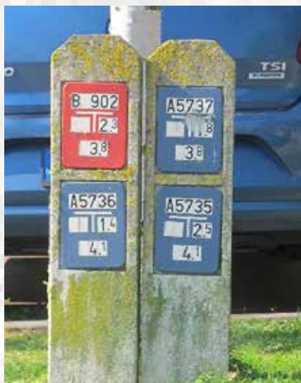
Aanwijzers voor een brandkraan en afsluiters in de Herman Gorterstraat

afsluiters van de waterleiding. De meeste aanwijzers in onze wijk zijn geplaatst op huizen, maar er zijn er ook die op eigen paaltjes, aan trolleybuspalen of aan straatlantaarns zijn bevestigd. Op de hoek