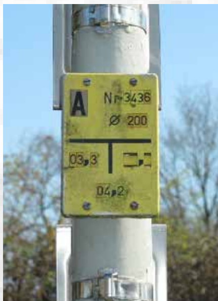
Aanwijzer op de hoek van de Bronbeeklaan en de Frederik van Eedenstraat

gasleiding een doorsnee van 200 centimeter. De leiding is, als je met de rug tegen de paal aanstaat, 3,3 meter naar rechts en 4,2 meter naar voren te vinden. In onze wijken vind je naast gele ook rode en blauwe bordjes. Beide verwijzen naar waterleidingputten. De rode bordjes (met aanduiding B of BK) verwijzen naar brandkranen; de blauwe bordjes (met aanduiding A, AS of DL) naar